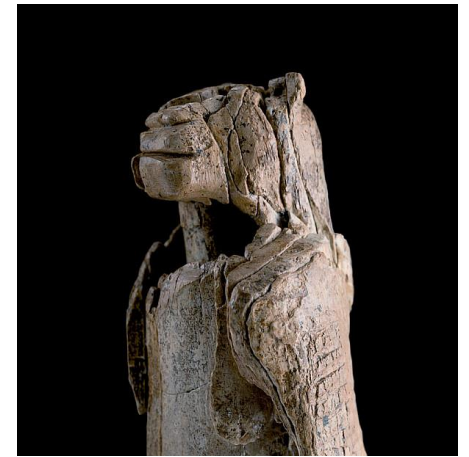
De leeuwenman, vroege symboliek, ongeveer 40.000 jaar oud.

Het verbeelden van fysiek niet-manifeste inhoud vereist de vorming van symbolen en dient de communicatie van voorheen ondeelbare inhoud. Dit is het startpunt van het begrip = mentaliseren